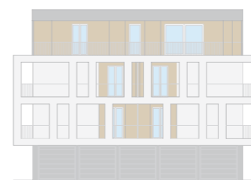
PROSPETTO LATO NORD