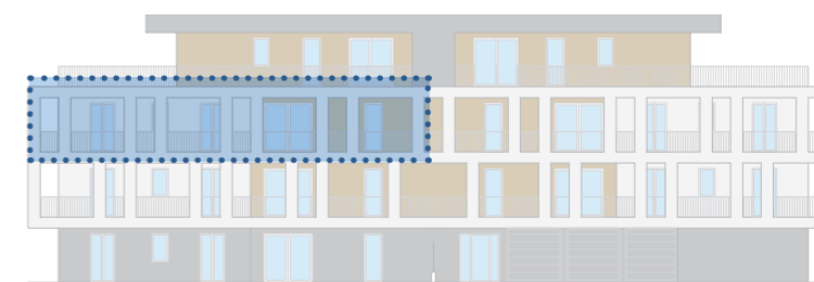
PROSPETTO LATO EST