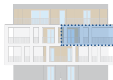
PROSPETTO LATO SUD