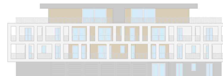
PROSPETTO LATO OVEST