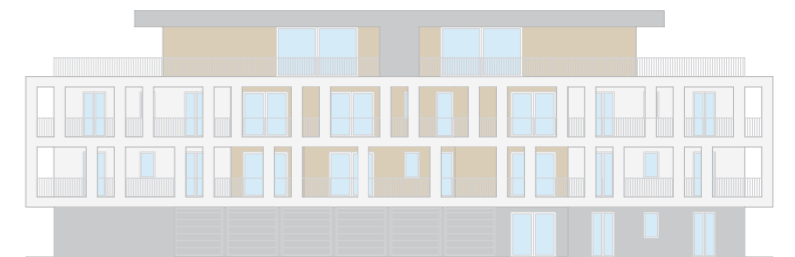
PROSPETTO LATO OVEST