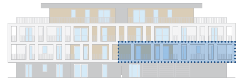
PROSPETTO LATO EST