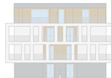
PROSPETTO LATO SUD